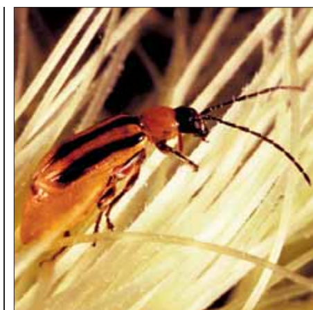
Der Maiswurzelbohrer ist der weltweit gefährlichste Maisschädling.

Beim Braunschweiger Julius Kühn-Institut gibt es jedoch Zweifel, „dass es die Hersteller bis zur nächsten Saison schaffen werden, die Beize ausreichend zu ver-