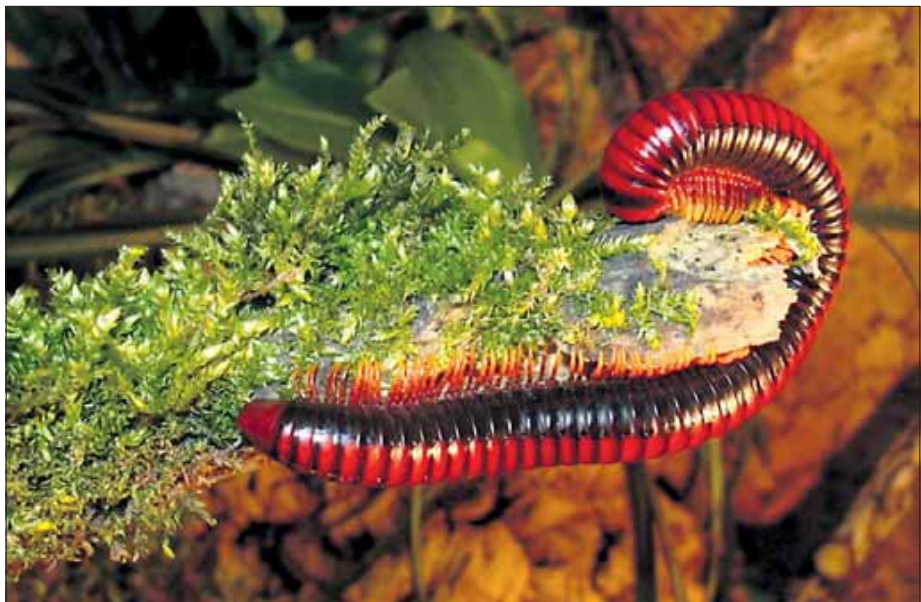
Der Feuertausendfüßer lebt auf Madagaskar. In Deutschland wird er von Liebhabern gezüchtet.